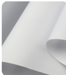
tela para ecosol