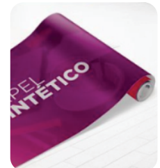
Papel para impresión ecosol